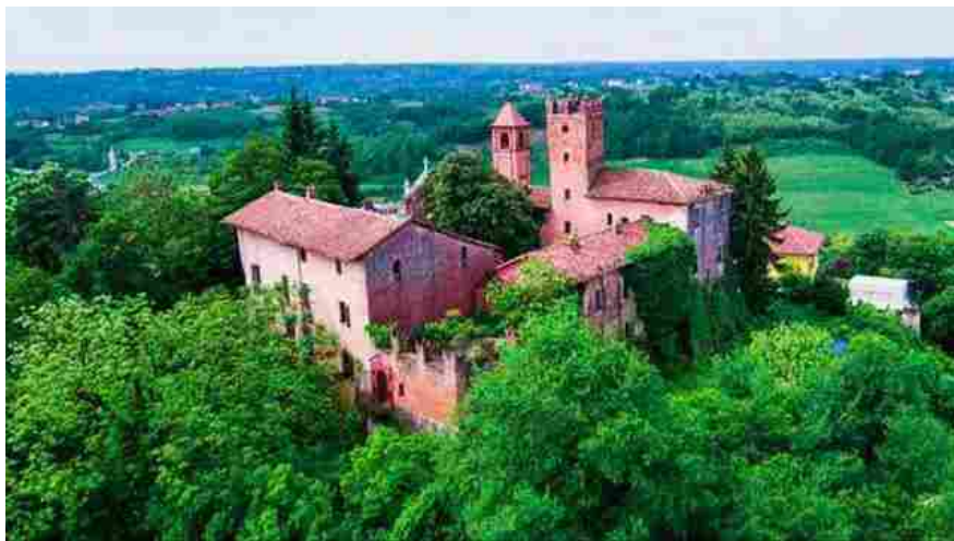
Il castello di Castellerò (Asti) è in via di trasformazione: dal 2022 ospiterà il condo hotel di Palm Mysuite

Palma Mysuite propone l’acquisto di unità immobiliari per uso privato e di investimento in alberghi di prestigio